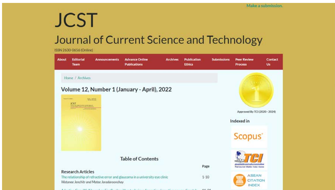
รูปที่ 2 หน้าเว็บไซต์ Vol. 12 No. 1 (January - April, 2022) ( https://jcst.rsu.ac.th/volume/12/number/3 )