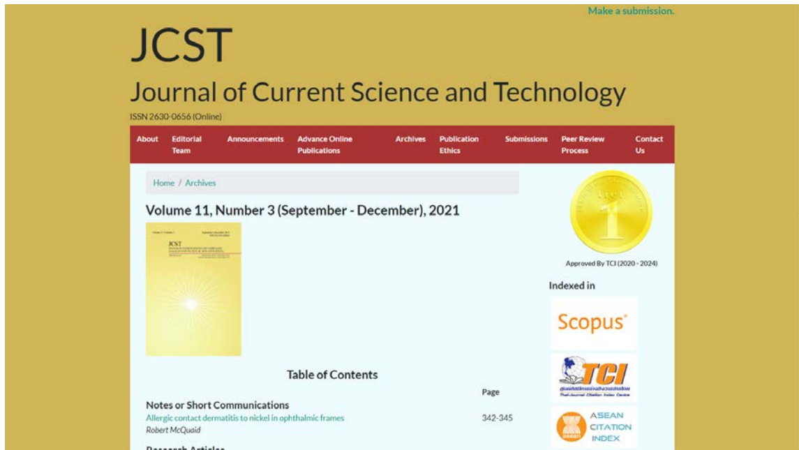
รูปที่ 1 หน้าเว็บไซต์ Vol. 11 No. 3 (September – December, 2021) ( https://jcst.rsu.ac.th/volume/11/number/5 )